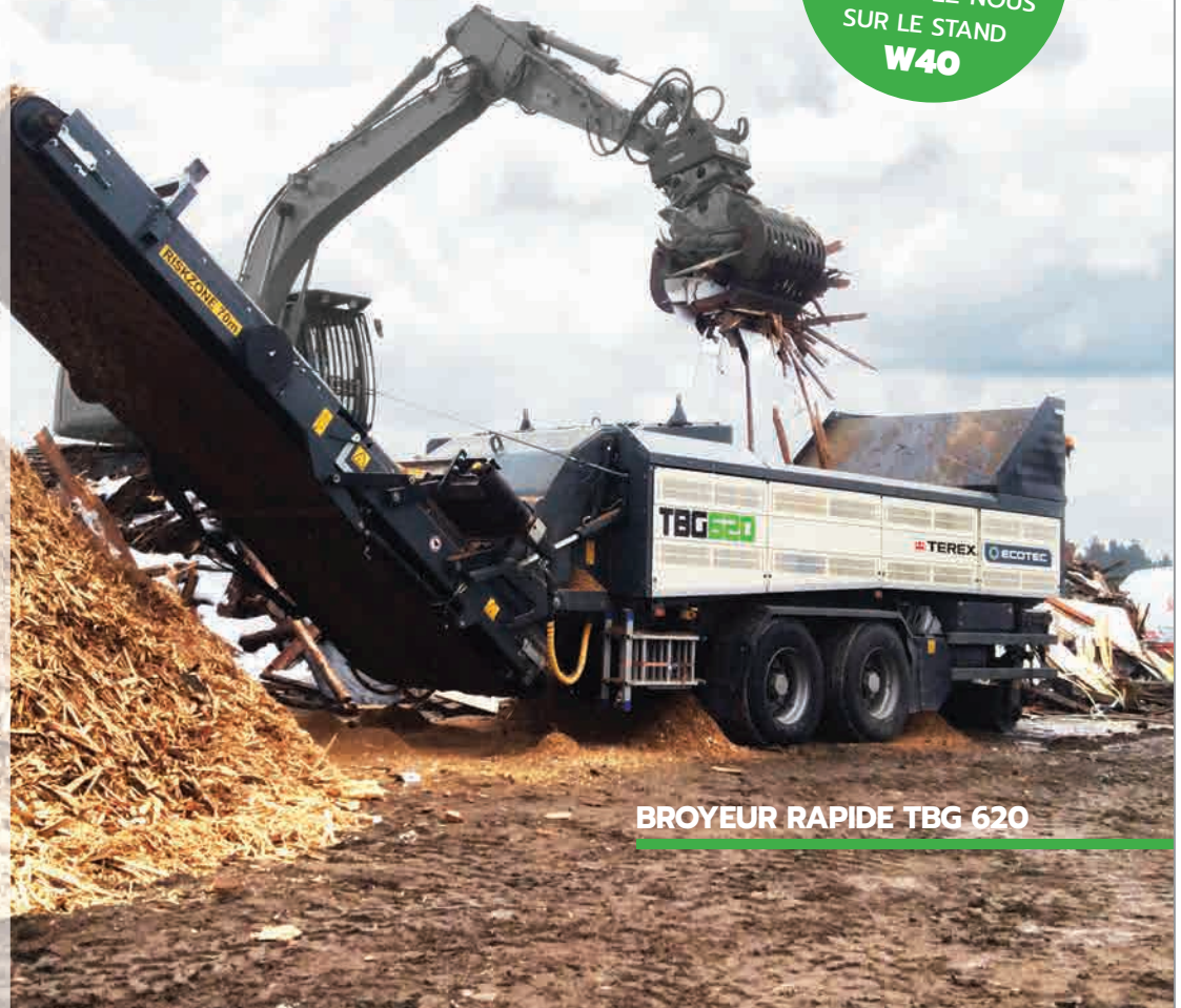
BROYEUR RAPIDE TBG 620